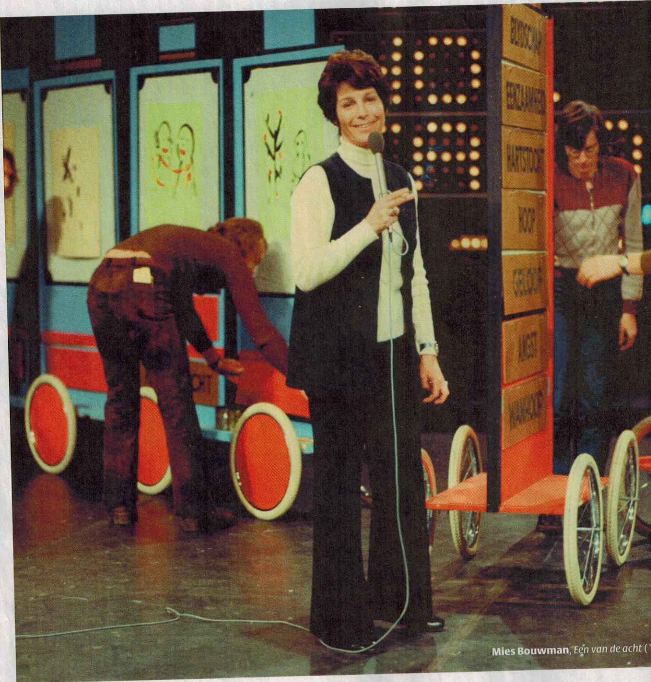
Mies Bouwman, Een van de acht (1)