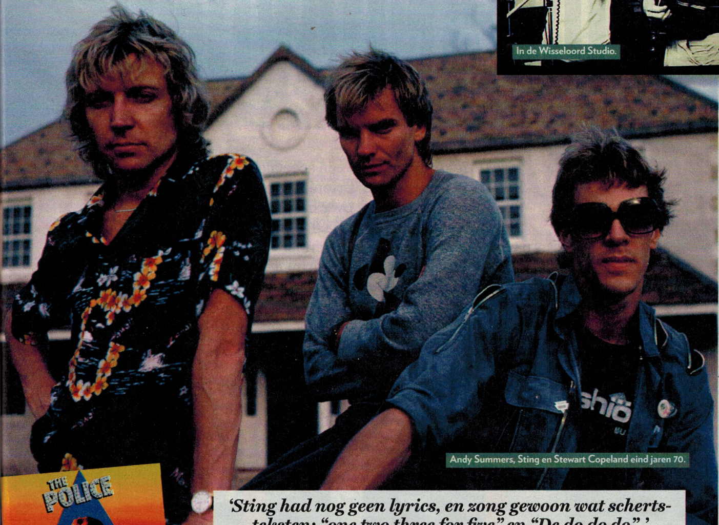
Andy Summers, Sting en Stewart Copeland eind jaren 70.