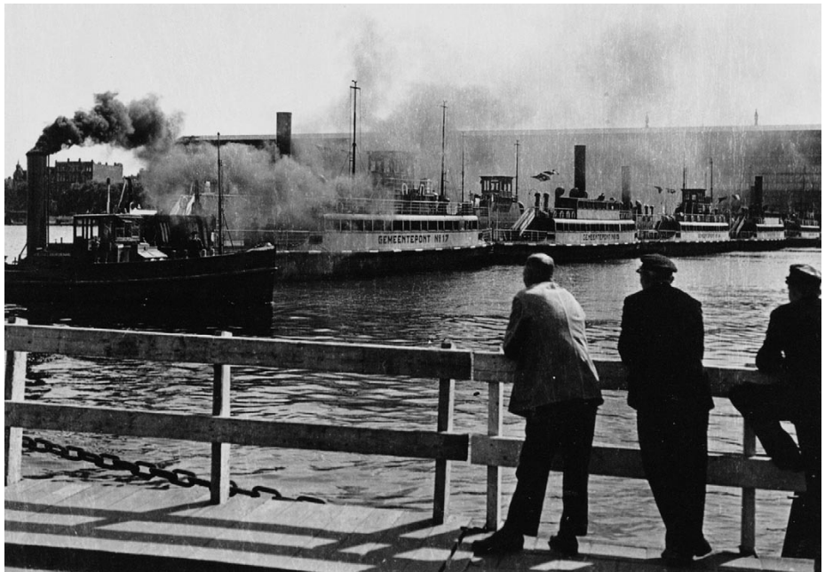
Brug van gemeenteponten in 1945