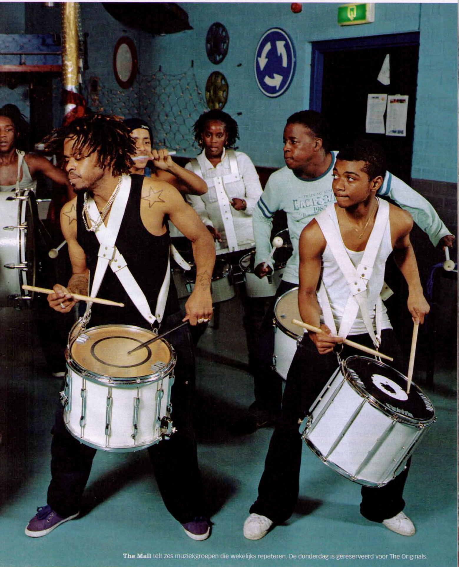
The Mall telt zes muziekgroepen die wekelijks repeteren. De donderdag is gereserveerd voor The Originals.