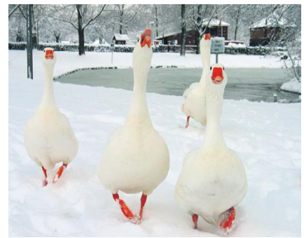
Gezinnen in het park

Van 1 maart tot 1 november mag in Noord-Holland weer op ganzen gejaagd worden. Hans Simons denkt dat jagen onmisbaar is voor het terugdringen van de ganzenoverlast, Ton Pieters vindt dat andere methoden effectiever zijn.