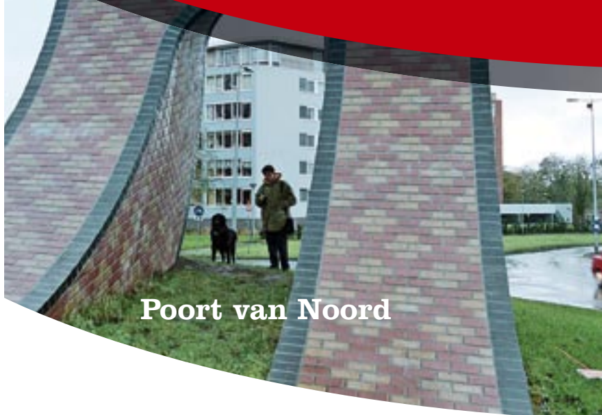
Poort van Noord