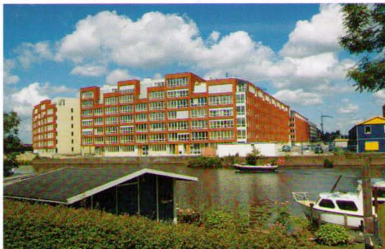
Van impressie naar werkelijkheid. Het Olympisch Kwartier nadert de laatste bouwfase

Het Olympisch Kwartier is ontworpen in de geest van de Amsterdamse School. Dit komt ook tot uiting in de kunst die verwerkt is in alle woonblokken. Overal in de wijk zie je bakstenen bloembakken met een boodschap, eigenzinnige huisnummers gezandstraald in glas of gegoten in aluminium en cirkels van neonlicht die reflecteren in de toegangspoorten.