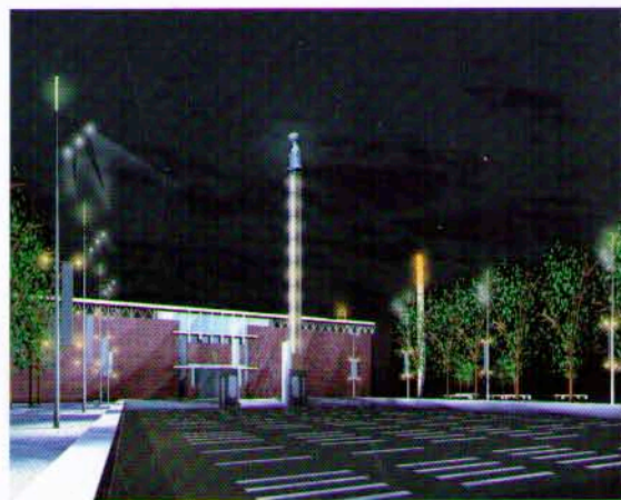
Sfeervol lichtontwerp voor Stadionterrein

Het stadsdeel heeft het vernieuwde Stadionterrein op 4 juli 2007 feestelijk geopend. Om het terrein te verlevendigen, zit in het ontwerp van Sant & Co een aantal extra sportvoorzieningen, zoals een Cruyff Court voor voetbal en basketbal, een jeu de boulesbaan en 's zomers een beachvolleybalveld. Het terrein is geschikt gemaakt voor het houden van evenementen. Bijzonder is het lichtontwerp van Henk van der Geest. In totaal komen rondom het stadion 45 lichtmasten. Het voorplein krijgt speciale verlichting. Op de top van de lichtmasten komt een toorts. Bij evenementen kunnen de organisatoren verschillende lichtsferen creëren. Omdat de masten ruim vijftien meter lang zijn en de bodem erg zacht is, worden deze masten op een unieke manier geplaatst. Ze komen op heipalen te staan, die er met mast en al worden ingeboord. Het stadsdeel en de Dienst Infrastructuur, Verkeer en Vervoer voltooien de uitvoering van het lichtontwerp in het voorjaar van 2008.