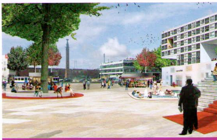
Impressie van het nieuwe Stadionplein

Voor vragen over de werkzaamheden, kunt u contact opnemen met Stadsdeel Oud-Zuid, afdeling Projecten, tel. 020 678 1678.