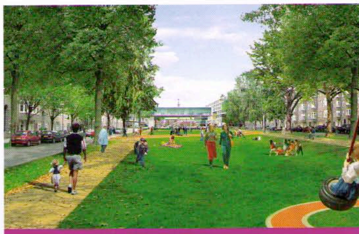
Het Van Tuyl van Serooskerkenpark volgens het plan van OMA