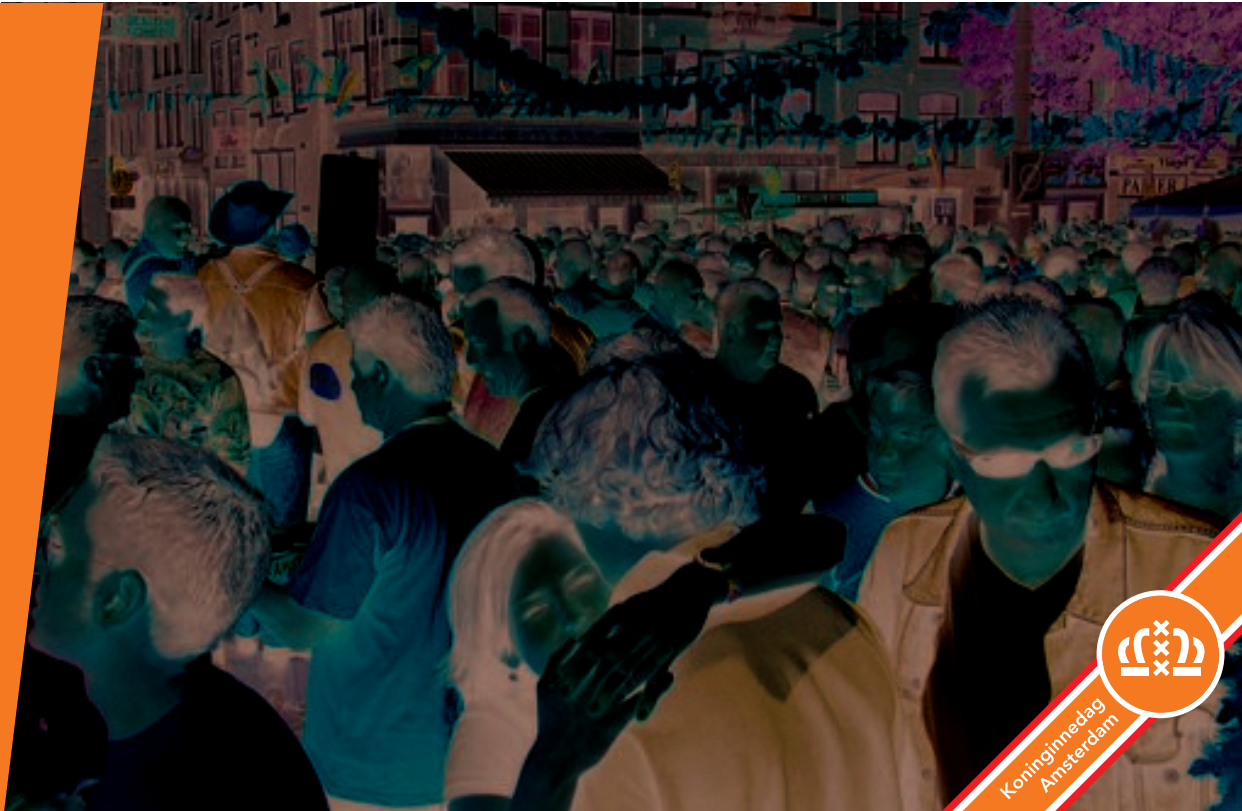
Op 30 april is het feest en kleurt de binnenstad oranje.

4 Zonder regels wordt het een gekkenhuis — In eerste instantie gaat het om de veiligheid — Vorig jaar waren er dertig drinkelingen — Originele en creatieve ideeën