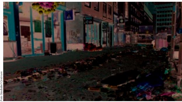
Het is hard werken om de binnenstad na het feest weer schoon te maken.

Op de vrijmarkt wordt voorlichting gegeven en worden tevens vuilniszakken verstrekt. En vanaf acht uur ’s avonds gaan onze ploegen aan de slag om de binnenstad weer schoon