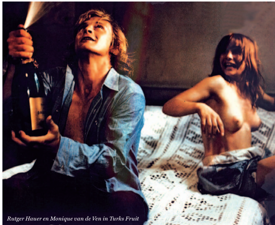
Rutger Hauer en Monique van de Ven in Turks Fruit