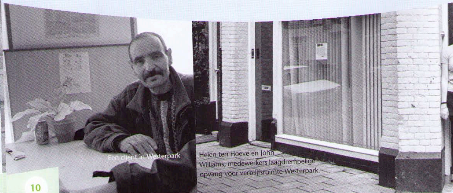
Een cliënt in Westerpark

Als gebruikers de verblijfsruimtes eenmaal hebben ontdekt, lukt het vaak ook wel om ze op andere terreinen van dienst te zijn. Evert-Jan Sterkenburg: "Door met ze in gesprek te komen, kun je erachter komen wat ze bezighoudt en met welke problemen ze kampen. Vervolgens kunnen we gebruikers doorverwijzen naar het veldwerk of andere organisaties. Of ze stimuleren om deel te nemen aan de activiteiten in de opvangruimtes. In de meeste gevallen kunnen we zeker wat voor