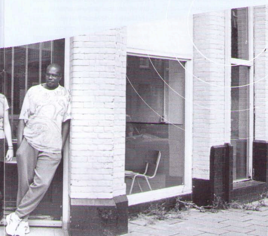
Een gebruikende cliënt

De teamleider: "Het is een beetje afhankelijk van de ruimte. In de Princehof komen zestig vaste bezoekers, dus daar loopt de spanning wel eens op. Maar ik heb ook het idee dat daar wat meer mensen komen met psychische problematiek. In de andere twee ruimtes hebben we zo goed als geen last van problemen door druggebruik."