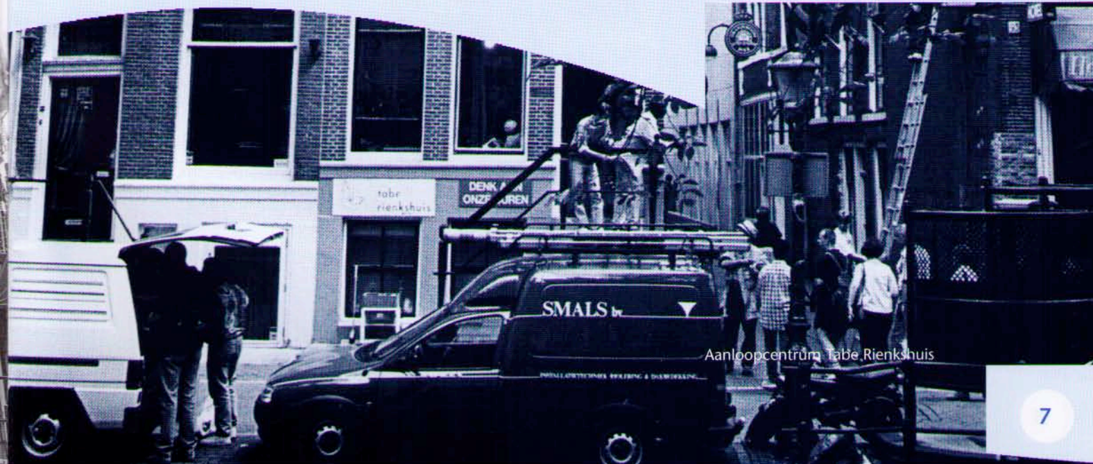
Aanloopcentrum Tabé Rienkshuis

"Gebruikers kunnen hier onder meer spelletjes doen of deelnemen aan een van de werkprojecten, zoals het kookproject en het veegproject. Het publiek dat hier komt is gemiddeld wat jonger dan in het Tabé Rienkshuis."